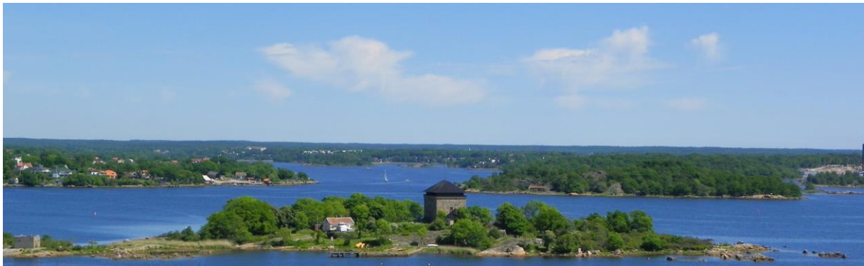
Mjölhareholmen med Hästö ovanför till vänster.