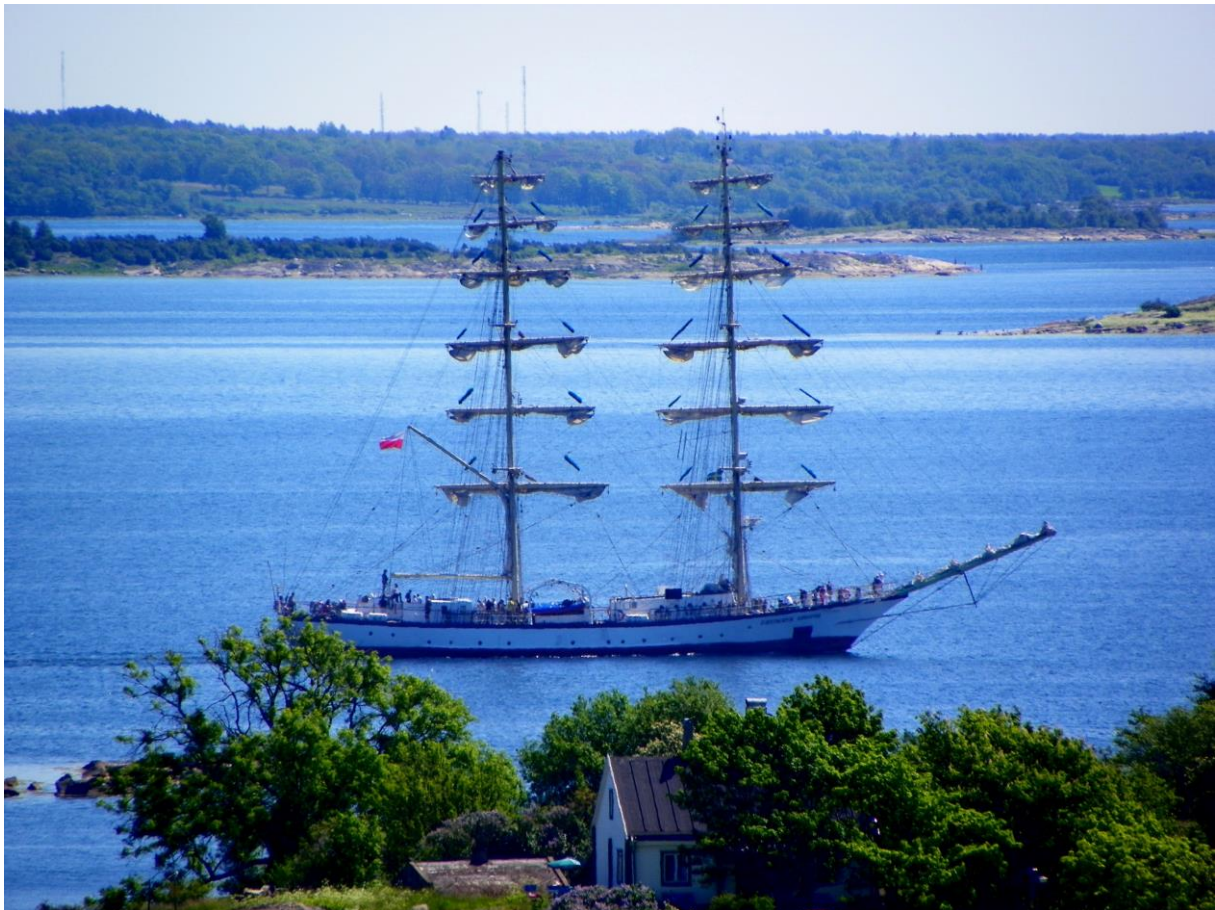
Polskt segelfartyg passerar Basareholmen.